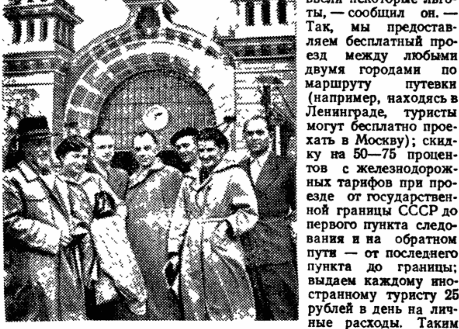
Группы немцев из ГДР. Одна из немецких групп будет отдыхать в Батуми до 11 сентября, а затем через Москву вернется на родину.

БАТУМИ. Здесь гостили 62 туриста из Чехословакии и две